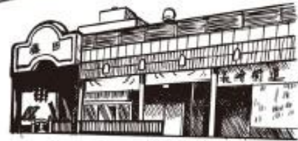
藤田なかばし商店街